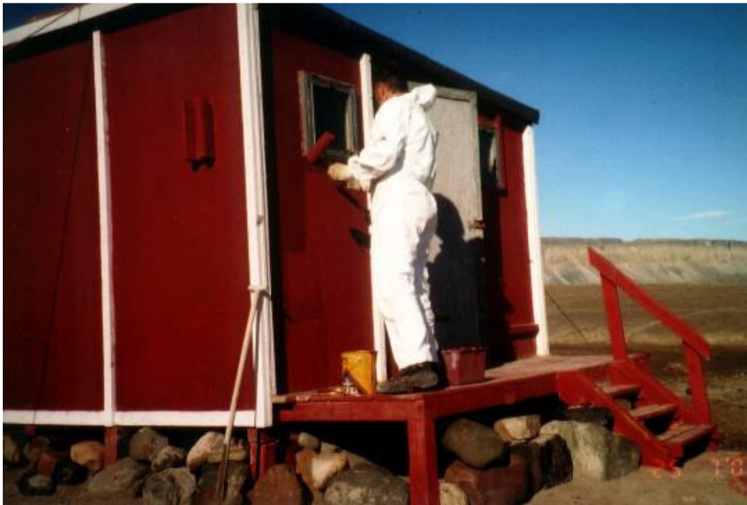
Kap Harald Moltke. Gæstehuset males.

Vi havde transport til og fra Station Nord med forswarets fly, og herfra med lejet Twin Otter til og fra Kap Harald Moltke.