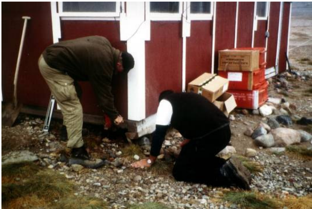
Kap Harald Moltke. Bygningen bringes i vater.

Brønlundhus har i dag karakter af et museum, der fortæller om en vigtig periode i arktisk videnskabs historie i sidste halvdel af forrige århundrede. De mange genstande udgør i dag en historisk samling, og det er Nanoks forslag til Peary Land Fondens bestyrelse, at hus og genstande bevares som sådanne.