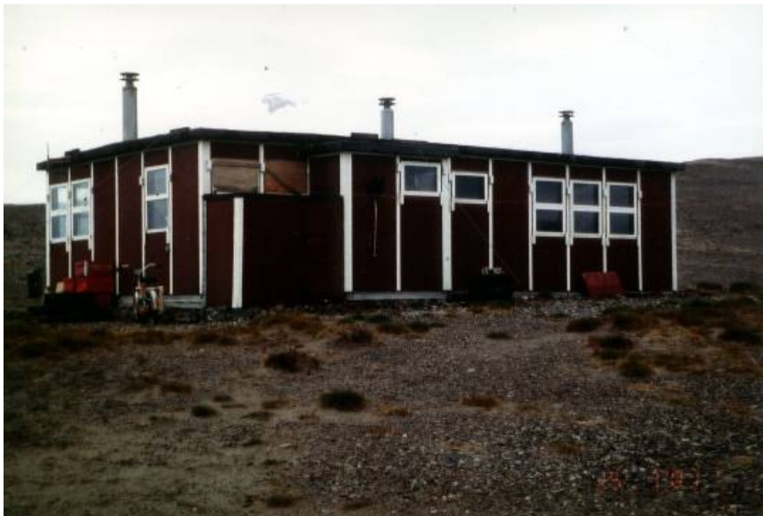
"Moltkehus" på Kap Harald Moltke.

Vi fandt begge stationer med tilhørende sidebygninger i rimelig god stand, og vi foretog mindre reparationer og udvendig vedligeholdelse med maling og tagpap. Landingsbanen ved Kap Harald Moltke var i tør tilstand god og ville kunne modtage et Herculesfly, som det ofte har gjort før.