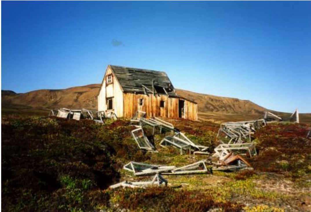
Sverresborg”. Stationen er i dårlig stand, og det vil kræve mange materialer og sandsynligvis flere sæsoners arbejde at renovere den, men det er en mulig opgave.

Vi ankom ”Antarctichavn” 18. august kl. 20.30 efter en tur med ret hård vind og sø, men der var heldigvis læ inde i bugten. Den næste dag blev bislaget beklædt med brædder og underpap.