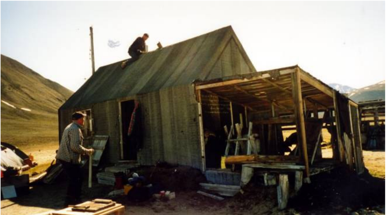
Restaureringen af Antartichavn er i fuld gang. Bislaget er rejst igen.

proviant og personligt grej. Afgik mod Antartichavn kl. 15.30. Her ankom vi kl. 20.30 efter en fin sejltur.