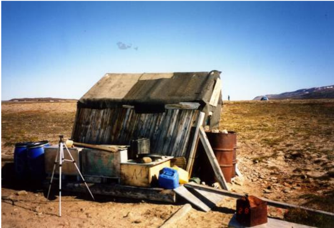
"Holm Bugt hytten" ved ankomsten

primært studerer lemminger, sneugler og ræve. Hytten var i meget dårlig stand og meget skæv. Den blev rettet op og forsynet med 2 lag tagpap.