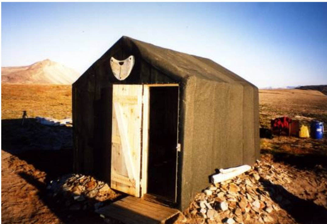
- og som den så ud, da vi forlod den.

Der blev fremstillet ny dør og skodder. Under vores ophold i Holm Bugt blev vi rigtig forkælede – og stiftede bekendtskab med den højere franske gastronomi under arktiske himmelstrøg.